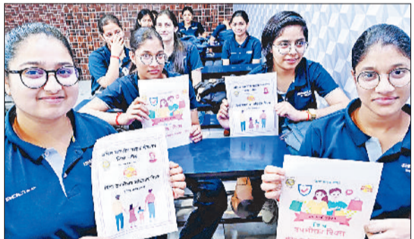
जीद। कार्यक्रम में भाग लेते हुए बच्चे।

विश्व उपभोक्ता अधिकार दिवस के अवसर पर अखिल भारतीय ग्राहक पंचायत और पहला कदम फाउंडेशन द्वारा संयुक्त रूप से जागरूकता कार्यक्रम का आयोजन किया गया। यह कार्यक्रम संगठन के स्थानीय कार्यालय में आयोजित हुआ, जिसमें बड़ी संख्या में युवा, सामाजिक कार्यकर्ता और उपभोक्ता अधिकारों से जुड़े लोग उपस्थित रहे। कार्यक्रम