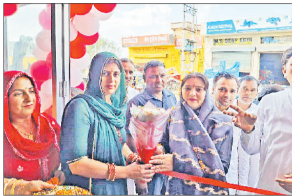
उचाना। भाजपा नेत्री सुषमा अत्री का स्वागत करते हुए।

के लिए लोगों को घंटों लाइनों में खड़ा रहना पड़ रहा है।