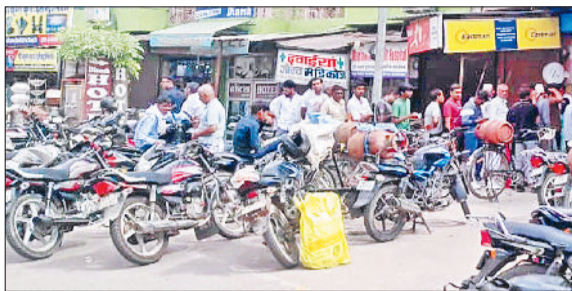
जीद। गैस एजेसी के बाहर लगी लाइन।

घरेलू गैस सिलेंडरों की बुकिंग के लिए 15 दिन की बजाए 25 दिन का समय दिए जाने व युद्ध के चलते भविष्य में गैस सिलेंडर की किल्लत का भय उपभोक्ताओं को गैस एजेसियों की तरफ खींच रहा है। जिन लोगों ने कभी गैस एजेसी का मुंह तक नहीं देखा था वो भी घंटों गैस सिलेंडर लेने की होड़ में बंदी गैस एजेसियों के बाहर खड़े होकर एक गैस सिलेंडर के लिए जदोजहद करते नजर आ रहे हैं। गैस सिलेंडर लेने के लिए सिफारिशें, जुगत तक लगाई जा रही हैं। प्रशासन लाख गैस सिलेंडरों की कोई कमी न होने के दावे कर रहा हो लेकिन जिले की गैस एजेसियों पर भीड़ लगातार बढ़ रही है। हालात यह हैं कि कई एजेसियों के बाहर उपभोक्ताओं की लंबी कतारें सड़क तक पहुंचने लगी हैं। सुबह से ही बड़ी संख्या में लोग खाली सिलेंडर लेकर एजेसियों पर पहुंच रहे हैं। पहले जहां उपभोक्ताओं को कम समय में