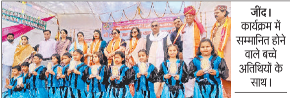
जीद। कार्यक्रम में सम्मानित होने वाले बच्चे अतिथियों के साथ।