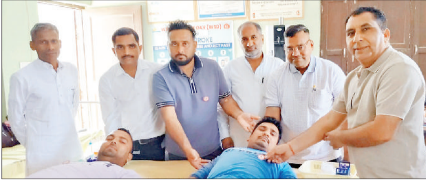
कलायत। गांव बड़सीकरी कलां में रक्तदाता को बैज लगाते मुख्य एवं विशिष्ट अतिथि।