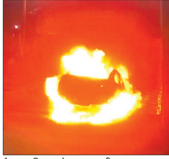
कैथल। सिरटा रोड पर जलती कार।