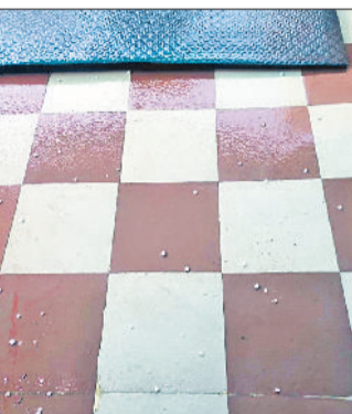
जींद। बारिश के साथ गिरे ओले।