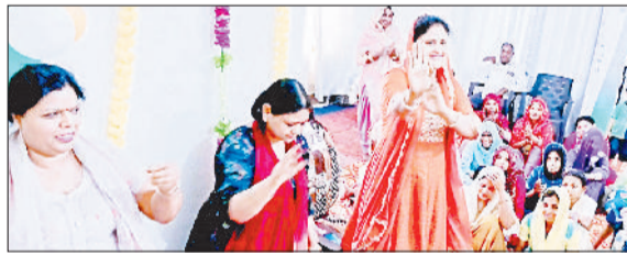
जीद। अखंड जाप के दौरान झूमते श्रद्धालु।

करते नजर आईं। बता दें कि इस परीक्षा के लिए जिले भर में 128