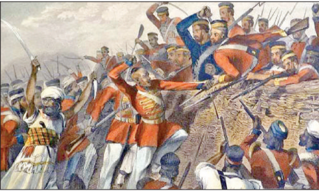
सोनीपत जिले के खरखौदा कस्बे में 15 अगस्त 1857 को हुए भीषण युद्ध के दौरान अंग्रेज सेना से भिड़ते क्रान्तिकारी। (सांकेतिक चित्र)