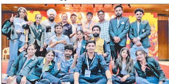
जींद। सीआरएसयू की दूसरे स्थान पर रहने वाली टीम।

विश्वविद्यालय की टीम ने अंधविश्वास विषय पर आधारित एक सशक्त और विचारोत्तेजक प्रस्तुति दी। इस प्रस्तुति में समाज में व्याप्त अंधविश्वास और उसके दुष्परिणामों को अत्यंत संवेदनशील एवं प्रभावी ढंग से मौचित किया गया। प्रस्तुति में चर्चित बुराई घटना से प्रेरित प्रसंगों के माध्यम से यह संदेश दिया गया कि अंधविश्वास व्यक्ति, परिवार और समाज तीनों के